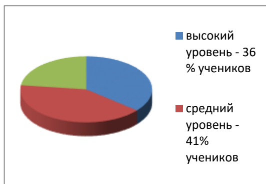
Рис.1 - Уровень освоения изученных орфограмм на констатирующем этапе

Анализ полученных данных констатирующего эксперимента позволяет сделать некоторые выводы о характере наиболее типичных орфографических ошибках в письменных работах учащихся.