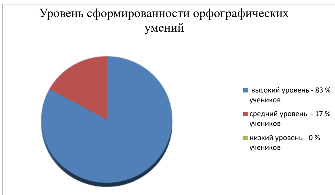
Рис.3 - Результаты контрольного диктанта

Для решения поставленных задач был проведен контрольный диктант,