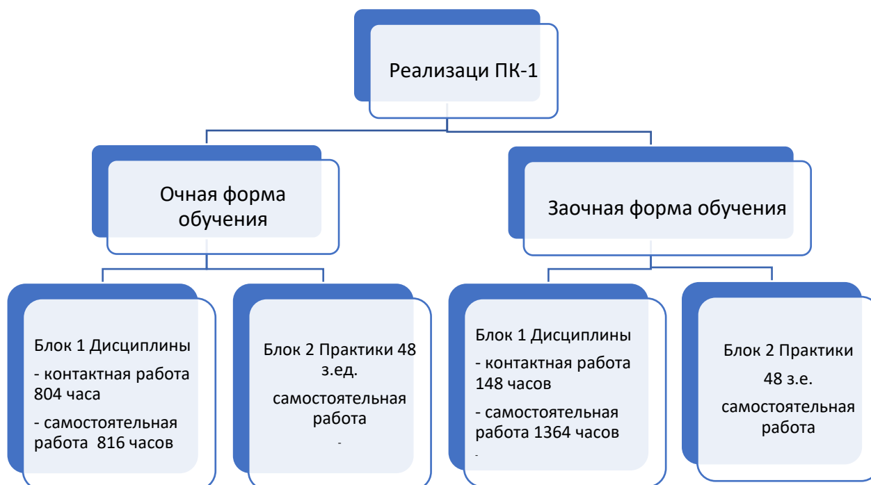
Схема 2 – Особенности реализации ПК-1 на очной и заочной формах обучения