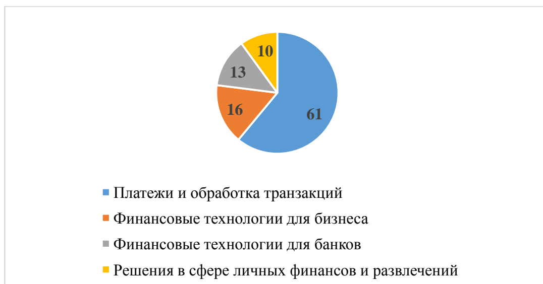
Рисунок 3 – Доля сегментов рынка финтех России в 2021 году

Далее рассмотрим, на какие сегменты и в каких объемах распределена отрасль финтех России: