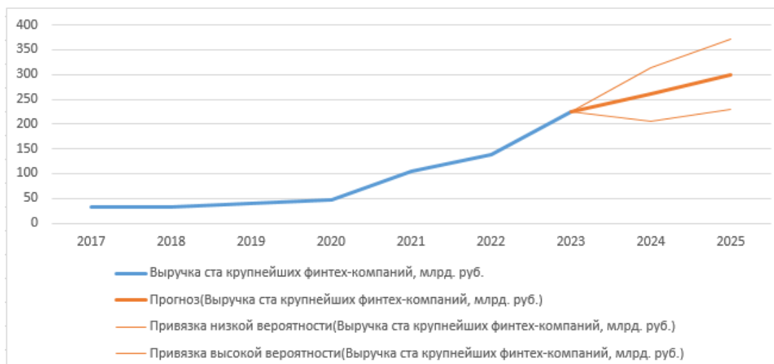
Рисунок 2 – Прогноз выручки ста крупнейших российских финтех-компаний на 2025 год