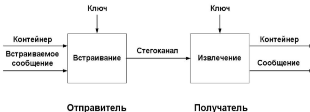
Рисунок 1 – Структурная схема стegosистемы

Структурная схема стegosистемы представлена на рисунке 1. Сообщение – это любая информация, подлежащая скрытой передаче.