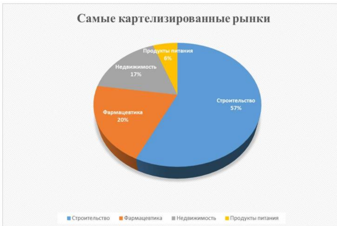
Рисунок 3.-Самые картелизированные рынки в РФ [40]

Лидерами в 2021 году по количеству выявленных нарушений, связанных с заключением ограничивающих конкуренцию соглашений, стали рынки ремонта и строительства, в том числе автомобильных дорог, лекарственных препаратов и медицинских изделий.