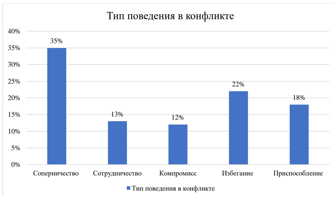
Рисунок 1. Распределение показателей типа поведения в конфликте среди исследуемых подростков

Полученный результат представлен на рисунке 1.