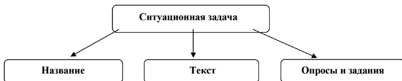
Рисунок 1 – Структура ситуационной задачи (сост. Шабанова И.А.)

В работе И.А. Шабановой была определена структура ситуационной задачи, изображенная на рисунке 1: