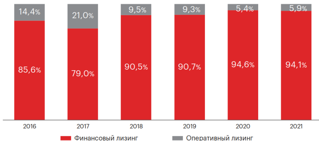
Рисунок 1 – Доля финансового и оперативного лизинга в России за 2016 - 2021 г.г. [44]

О соотношении финансового и оперативного лизинга свидетельствуют данные рис. 1.