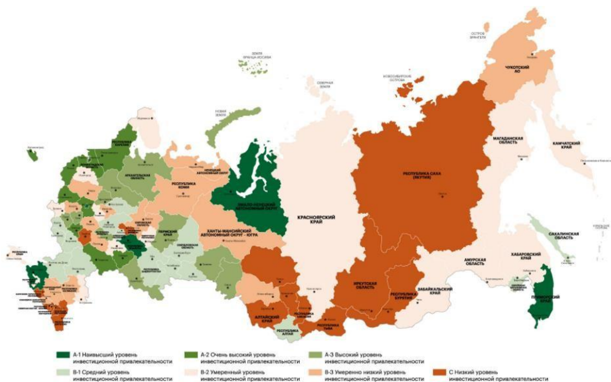
Рисунок 1 – Инвестиционная привлекательность регионов РФ, 2024 год 3

Наибольшая концентрация инвестиционной привлекательности наблюдается в Московской агломерации, нефтегазодобывающих регионах Западной Сибири и Татарстане. Депрессивные территории Северного Кавказа и Дальнего Востока (кроме Приморья) характеризуются низкой привлекательностью.