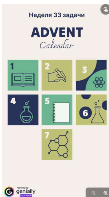
Рисунок 3 - Вид адвент-календаря «Неделя 33 задачи»

Структура авторского адвент-календаря (рис. 3) включает 7 «окошек», с которыми учащиеся могут работать в своем темпе, но не менее 1 «окошка» в день.