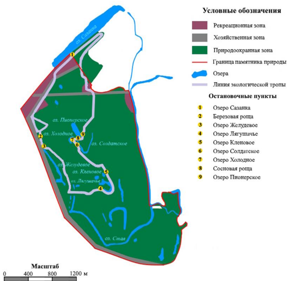
Рисунок 1 – Экологическая тропа «По тропинкам Ставского леса» (составлено автором по (Лесопарк «Тинь-Зинь»..., [Электронный ресурс], 2026))

Природно-рекреационный потенциал представлен ООПТ «Урочище Тинь-Зинь». На ее примере осуществлен анализ действующей экологической тропы протяженностью 5 км и продолжительностью 3 часа (Рисунок 1).