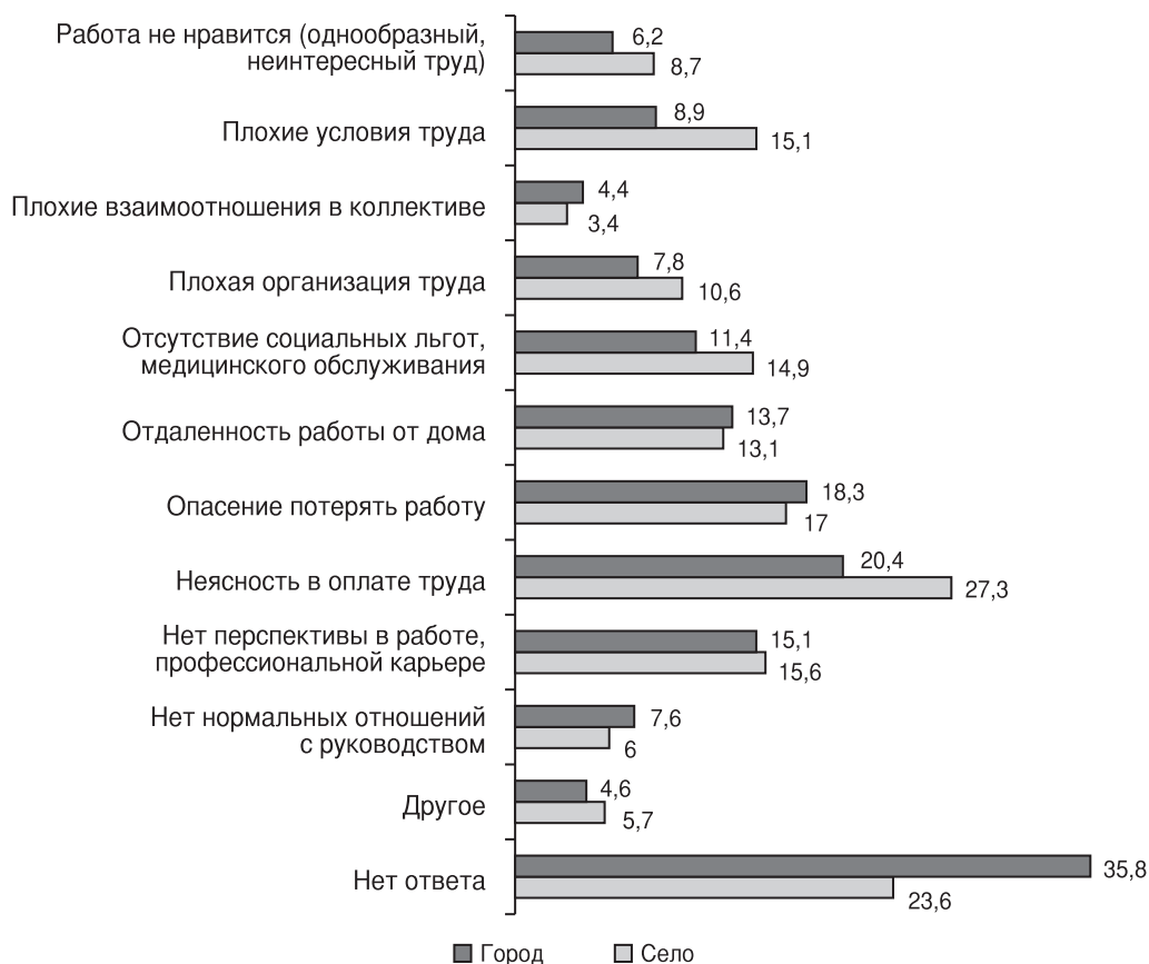
Рис. 1. Проблемы, волнующие сельских жителей по месту работы (в % от опрошенных, возможность выбора нескольких вариантов ответа).