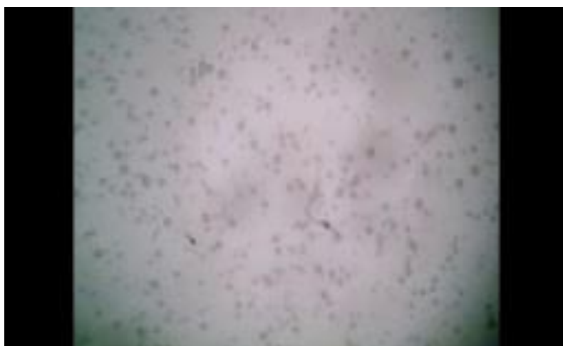
Рисунок 1 – Представление информации о размере частиц аэрозоля при значении яркости изображения 0,2