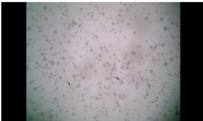
Рисунок 2 – Представление информации о размере частиц аэрозоля при значении яркости изображения 0,4

Анализ полученных снимков и пересчет размеров частиц, выполненный при помощи программы GIMP показал, что одни и те же частицы, представленные на снимках имеют разный размер.