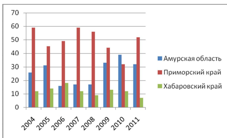
Рисунок 2 - Доля регионов во въездном туристском потоке Дальневосточного федерального округа, в % (составлен автором по материалам [25])

Важно отметить, что, хотя указанные регионы также формируют свыше 90% въездного туристического потока, рейтинг регионов здесь несколько иной (Рисунок 2). Как видно из представленной диаграммы, наибольший удельный вес иностранных туристов, въезжающих на территорию Дальневосточного федерального округа, приходится на Приморский край. Причем его доля на протяжении рассматриваемого времени была нестабильной. Так, после резкого сокращения числа принятых иностранных туристов в 2005 г. (до 45%) к 2007 г. край вновь достиг уровня 2004 г. (59%). Однако в последующие годы снова отмечалось снижение этого показателя [25].