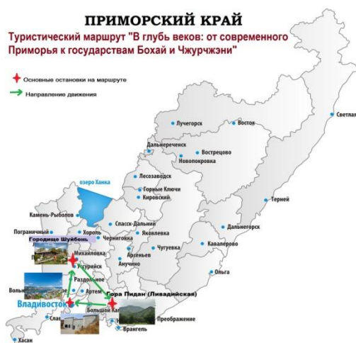
Рисунок 4 – Туристический маршрут (составлен автором по материалам [4,5,6,22])

1 день. Прилет в аэропорт г. Владивосток. Трансфер в гостиницу «Жемчужина». Заселение. Обед в кафе гостиницы. Знакомство с экскурсоводом, который будет их сопровождать весь маршрут. Обзорная экскурсия по г. Владивосток (Эта экскурсия познакомит Вас с историей города: как он начинался небольшим морским постом на берегу бухты Золотой Рог, как развивался и рос, чем жил и дышал. Вы пройдете по улицам, помнящим историю города, посетите основные мемориалы и памятники. Продолжительность экскурсии: 3-4 часа Тип экскурсии: автобусная). Свободное время.