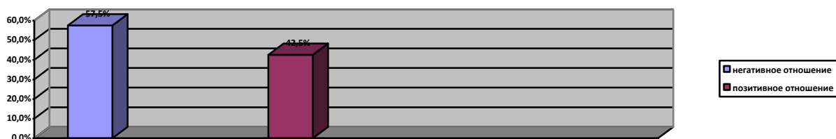
Рисунок 1 - Результаты анкеты «Отношение к службе» (Кормилицыной Т.М.)

Испытуемые первой группы уверены, что служба в армии делает из юношей настоящих мужчин и позволяет чувствовать себя достойными гражданами.