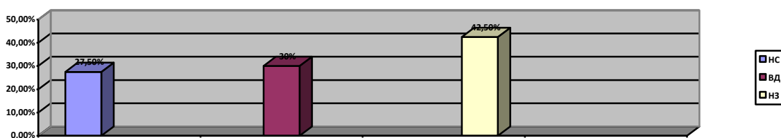
Рисунок 3 – Доминирующий тип направленности личности по методике «Направленность личности» (авторы: В Смейкал и М. Кучер)

Таким образом, мы видим, что наиболее представленным видом направленности является направленность на задачу, что составляет 42,5% всех респондентов.