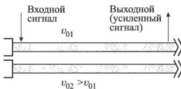
Рис.1. Схематическое изображение двухлучевого усилителя.

В третьей главе рассмотрим гидродинамическое описание электронного потока, которое привело нас к необходимости ввести понятие волн пространственного заряда, распространяющихся в потоке заряженных частиц, позволило применительно к рассмотрению системы с предварительной скоростной модуляцией электронного пучка существенно уточнить линейную кинематическую теорию пролётного клистрона. Рассмотрим теперь ситуацию, в которой ВПЗ не просто приведёт к уточнению какой-либо имеющейся теории, а позволит объяснить принцип работы двухлучевой лампы – усилителя, в котором используются два электронных пучка с немного различающимися скоростями, движущихся параллельно друг другу и сильно связанных через общее поле пространственного заряда (см. рис.1).