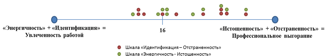
Рисунок 1. Результаты опросника OLBI

В параграфе 3.3 приводятся результаты исследования изменения психического состояния субъекта труда по континууму: увлеченность работой – профессиональное выгорание (Ольденбургский опросник профессионального выгорания, OLBI). Для более наглядного представления данных представим результаты на шкале от 1 до 32 ( Рисунок 1 ).