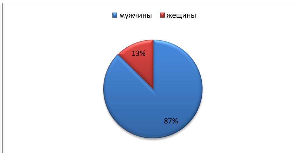
Рисунок 1.Гендерные характеристики допрашиваемых

а) Гендерные характеристики допрашиваемых (см.Рисунок 1):87%мужчин и13% женщин.