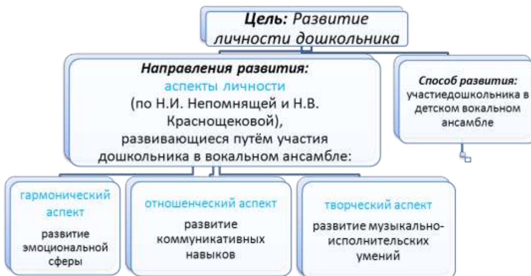
Рис. 1. Схема развития аспектов личности дошкольника – участника вокального ансамбля (по Н.И. Непомнящей и Н.В. Краснощековой).