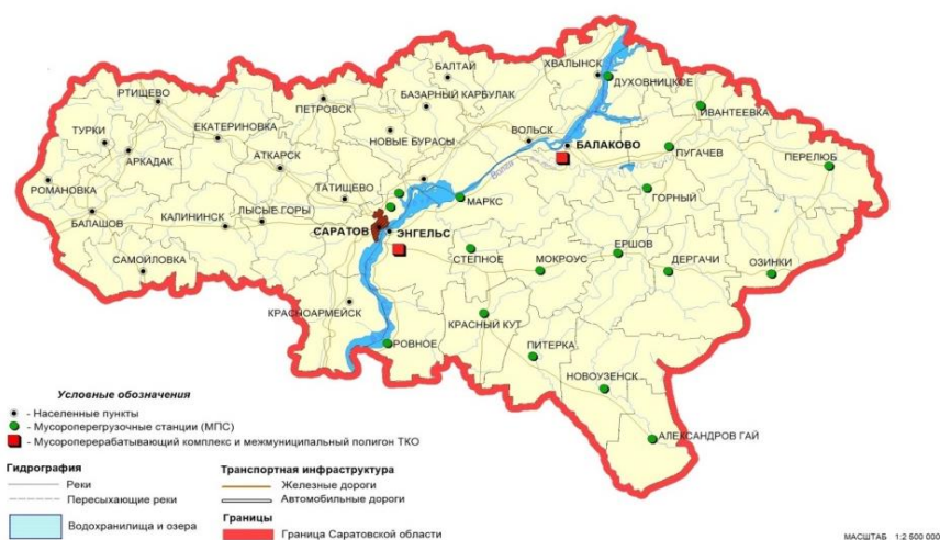
Рисунок - Интегрированная схема сбора, переработки и утилизации (захоронения ТКО) по Саратовской области (составлено автором по материалам «Обоснование деятельности филиала ... 2015 г.)

Из общего поступающего объема отходов Саратовского Комплекса 150 тыс. тонн/год количество сортируемых отходов, или вторичного сырья (бумага, картон, текстиль, лом черных и цветных металлов, отходы ПЭТ бутылок, бой стекла) составляет 30 тыс. тонн/год, на участок захоронения направляется 120 тыс. тонн/год отходов.