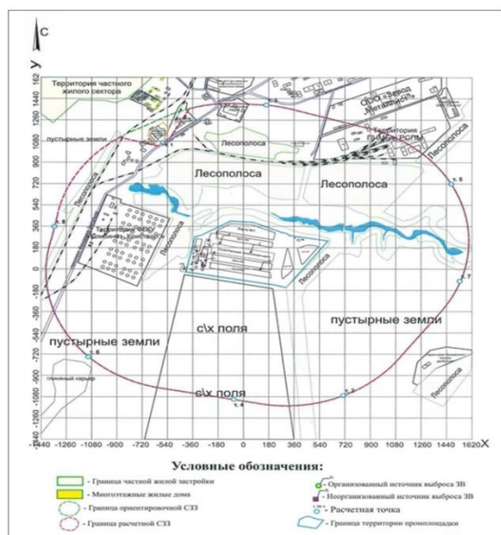
Рисунок - План-схема расположения источников загрязняющих веществ и расчетных точек для контроля за состоянием атмосферного воздуха в пределах границы СЗЗ предприятия (составлено автором по программе мониторинга..., 2017 г.)

На территории Комплекса действуют следующие источники выбросов загрязняющих веществ: Карты размещения (захоронения), дизель-генераторная установка, котел, а также строительная и транспортная техника.