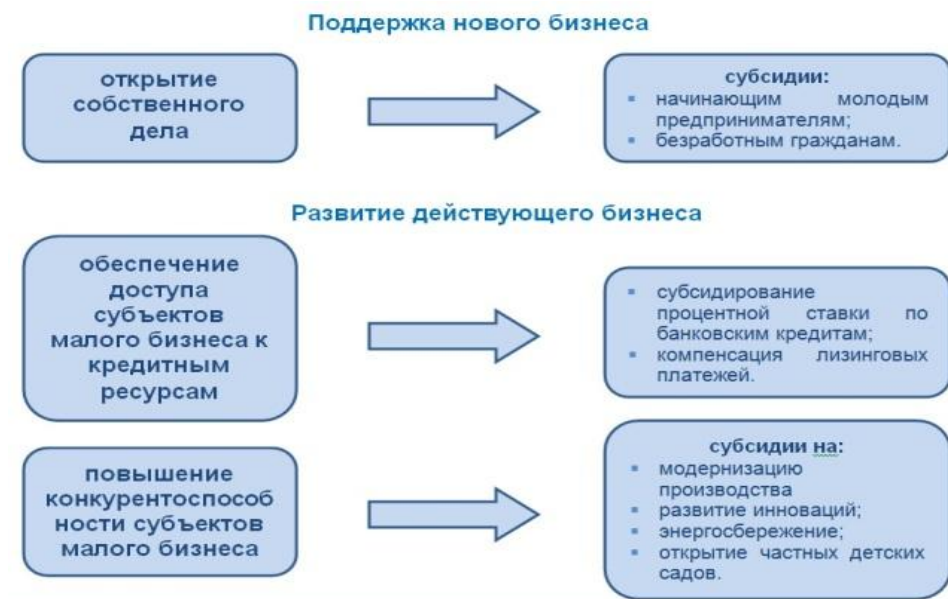
Рисунок 15 – Поддержка малого бизнеса 5

Таким образом, для предприятий, которые активно развиваются необходимо не только продлять льготы еще на два года, но предоставить дополнительную помощь в кредитовании, либо ввести необходимые льготы при аренде и лизинге. Это способствует тому, что у предприятий появятся деньги для покупки оборудования, найма новых работников.