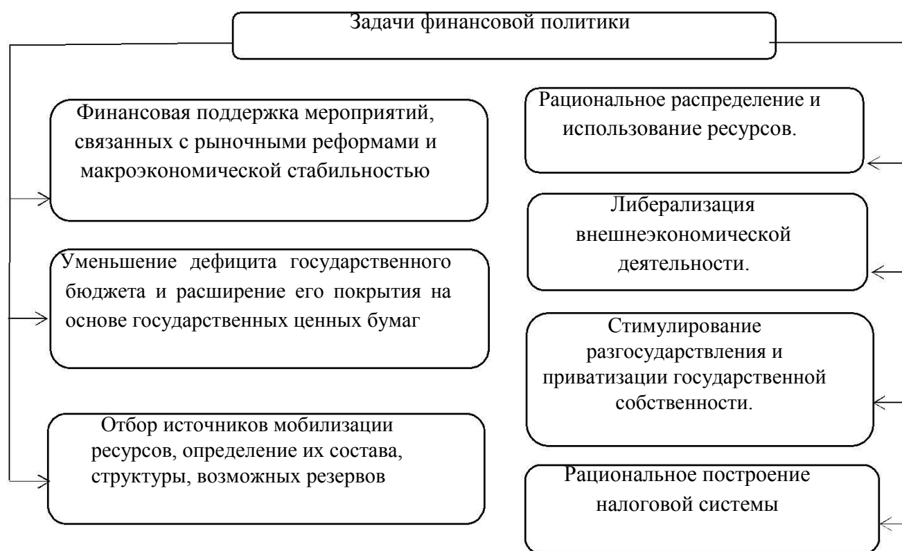
Рисунок 1 – Задачи финансовой политики 2