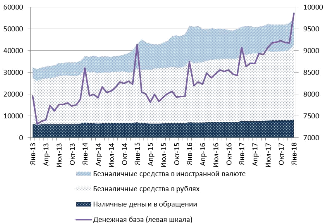
Рисунок 3 - Динамика денежных агрегатов, млрд. руб. 6

На последнем заседании Совета директоров Банка России, состоявшемся 9 февраля 2018 года, было принято решение снизить ключевую ставку до 7,5% годовых. Совет директоров Банка России 27 апреля 2018 года принял решение сохранить ключевую ставку на уровне 7,25% годовых. В этих условиях Банк России продолжит снижение ключевой ставки и допускает завершение перехода от умеренно жесткой к нейтральной денежно-кредитной политике в 2018 году.