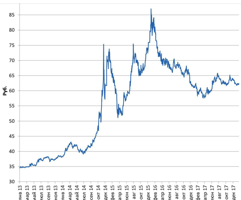
Рисунок 4 – Динамика бивалютной корзины в 2013-2017 гг. 7

В 2016 г. Банк России не проводил валютных интервенций в условиях режима гибкого курсообразования. В целом после мирового финансового кризиса Банк России существенно сократил степень своего вмешательства в функционирование валютного рынка в результате чего валютные интервенции стали оказывать все меньшее воздействие на динамику денежной базы.