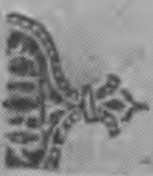
Заставка изъ закоширфного Четвероевангелія передъ евангеліемъ отъ Марфея