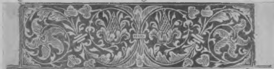
Заставка из среднешрифтного Четвероевангелия перед «Соборником»