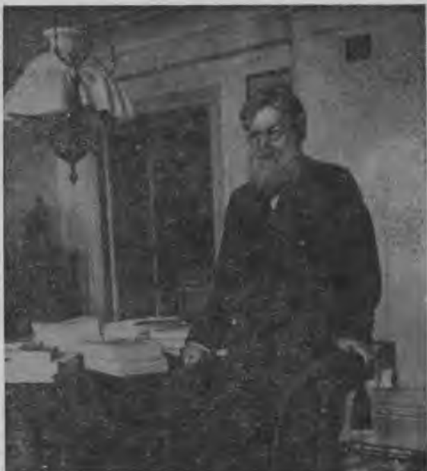
А. Н. Пыпин — академик, двоюродный брат Н. Г. Чернышевского. Фотография 1903 г.

«Положение» 1940 года закрепляло успехи, достигнутые музеем в научной, пропагандистской, собирательской и издательской деятельности со времени основания. В отличие от «Положения о музее», принятом в 1921 году, которое констатировало факт создания музея 22 , новое определяло цели и задачи научно-просветительного учреждения, имеющего хорошую научную основу и большой опыт в организации работы с массами.