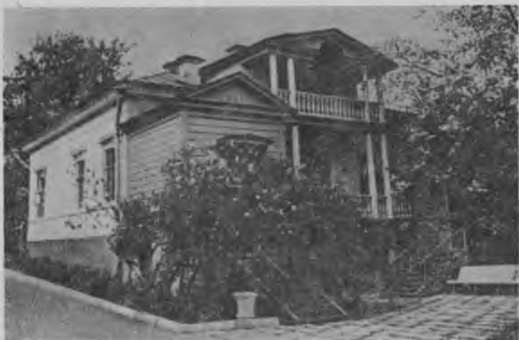
Государственный ордена «Знак Почета» Дом-музей Н. Г. Чернышевского

Под давлением общественности Саратовская городская Дума в марте 1917 года постановила приобрести в собственность города дом, где родился и жил Н. Г. Чернышевский. В марте того же года... «в помещении библиотеки Радищевского музея состоялось собрание местных журналистов, ученых и художников, созданных по инициативе литературно-художественного содружества «Многоугольник» для обсуждения во-