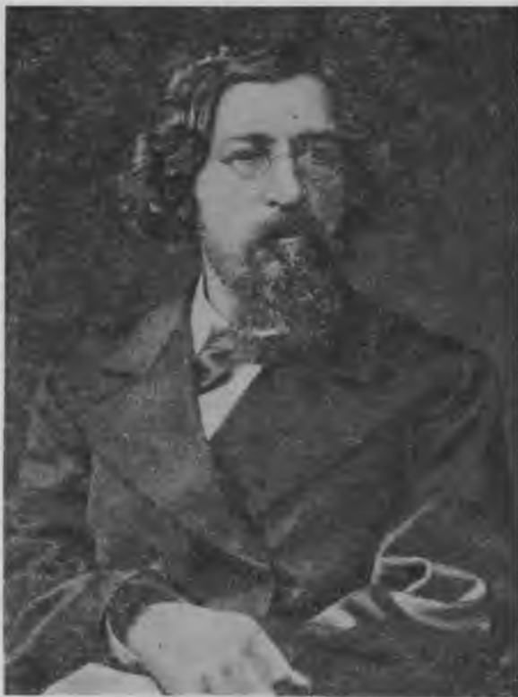
Н. Г. Чернышевский. Фотография 1883 г.

В апреле 1924 года М. Н. Чернышевский предпринял еще одну, ставшую для него последней, поездку в Москву, чтобы хлопотать перед Советом Народных Комиссаров об ассигновании средств на окончание работ по реставрации и ремонту