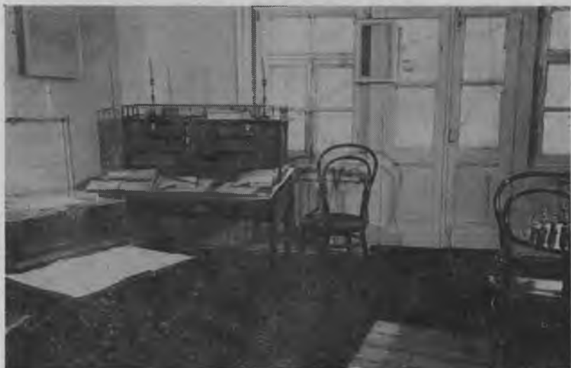
Во флигеле О. С. Чернышевской

XI. Н. Г. Чернышевский в его памятниках.