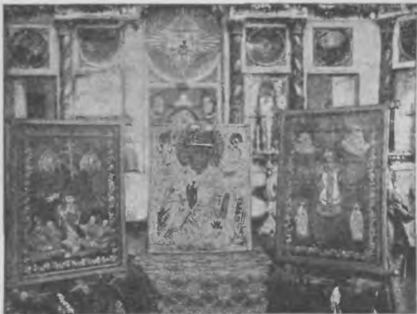
Образъ св. Николая Чудотворца.

У лѣваго клироса: по бархату шитое золотомъ и серебромъ въ срединѣ изображеніе Св. Чудотворца Николая и надъ нимъ справа и слѣва Иисусъ Христосъ и Марія-Дѣва; нѣскольکو ниже