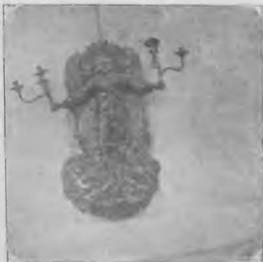
Лампада Дубовскаго собора.