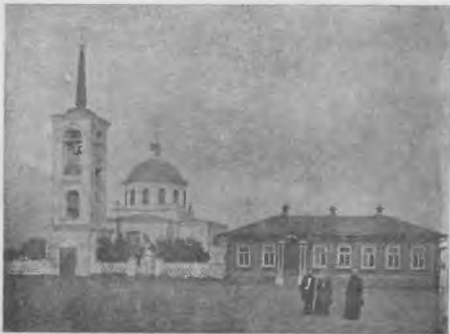
Видъ храма въ с. Лисичкинѣ.

Даемъ здѣсь фотографическіе снимки, исполненные членомъ Комиссіи А. А. Поповымъ, храма въ с. Лисичкинѣ, Аткарскаго у., и находящихся въ немъ трофеевъ войны 1812 года. Описаніе храма и прочаго сдѣлано членомъ Комиссіи И. С. Куликовымъ.