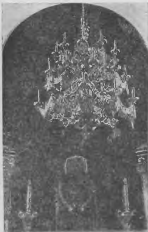
Паникадило въ томъ же соборѣ.