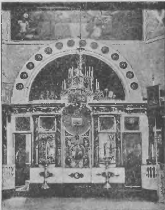
Внутренний видъ храма съ хоругвями.

Храмовой образъ Св. Николая Чудотворца, во имя коего освященъ лѣвый придѣлъ храма, древняго иконописнаго рисунка, въ серебряной кованой ризѣ, съ золочеными вѣнцами.