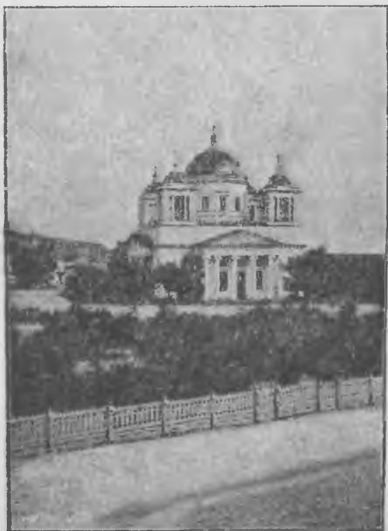
Видъ Вольскаго собора.

Авторъ «Записки» утверждаетъ, что задумавшій постройку его откупщикъ В. А. Злобинъ приступилъ къ осуществленію этого намѣренія не безъ вліянія на него, какъ говорятъ старожилы, достопамятныхъ событій 1812 года. Сборъ денегъ на постройку начался въ 1814 г. и Саратовскій губернаторъ А. Д. Панчулидзевъ подписалъ 1000 руб. Закончился сборъ постройкой только въ 1844 г.