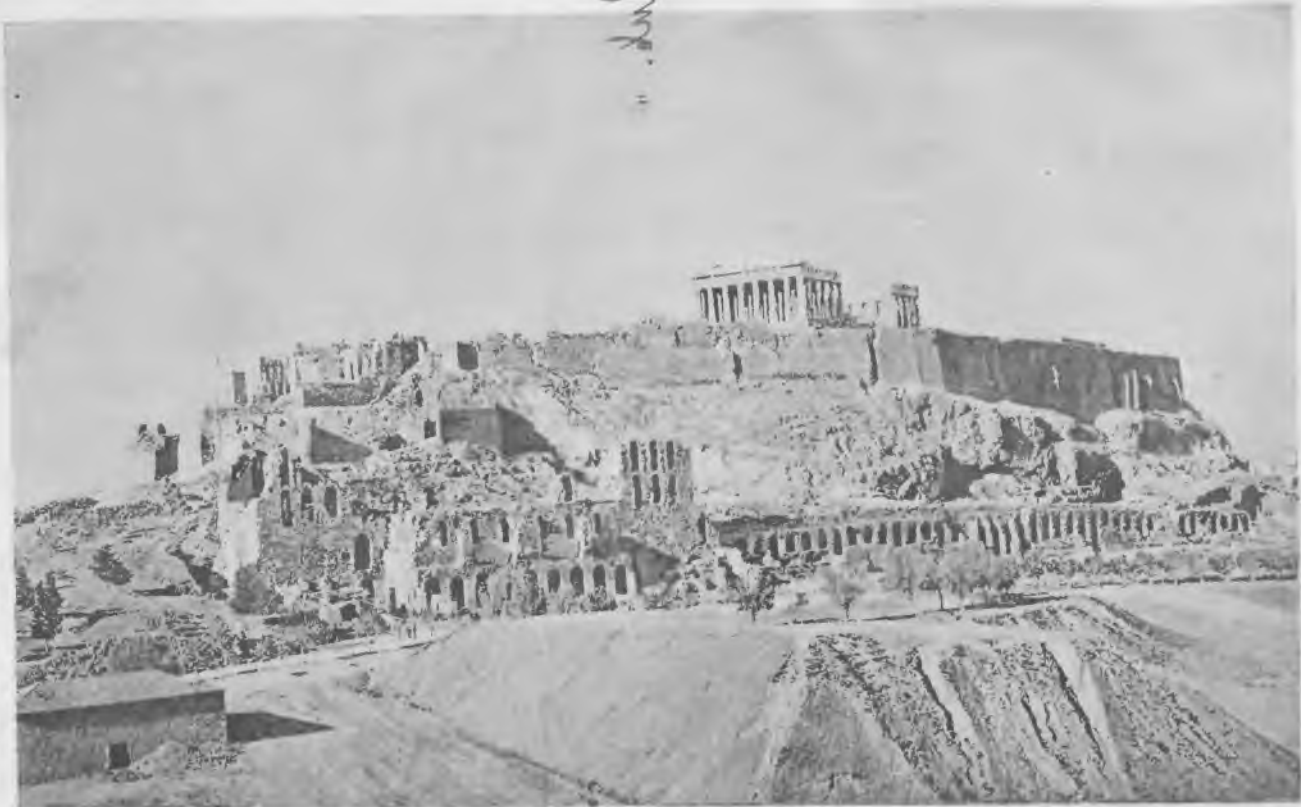
Аѳинскій акрополь въ настоящее время.