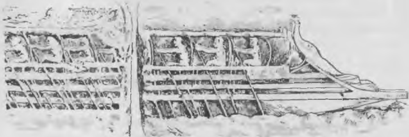
Передняя часть тріеры.

„Тріера отличалась легкостью и хорошимъ ходомъ. Известно, что она могла сдѣлать отъ 9 до 10 миль въ часъ (отъ 16 до 18 километровъ), а это хорошая скорость и для современныхъ пароходовъ. Она очень возвышалась надъ водой и, быть можетъ, была менѣе устойчива, чѣмъ современные суда. Но для грековъ этотъ недостатокъ былъ менѣе важенъ, чѣмъ для насъ. Въ Греціи навигація начиналась весной и заканчивалась осенью. Зимой же