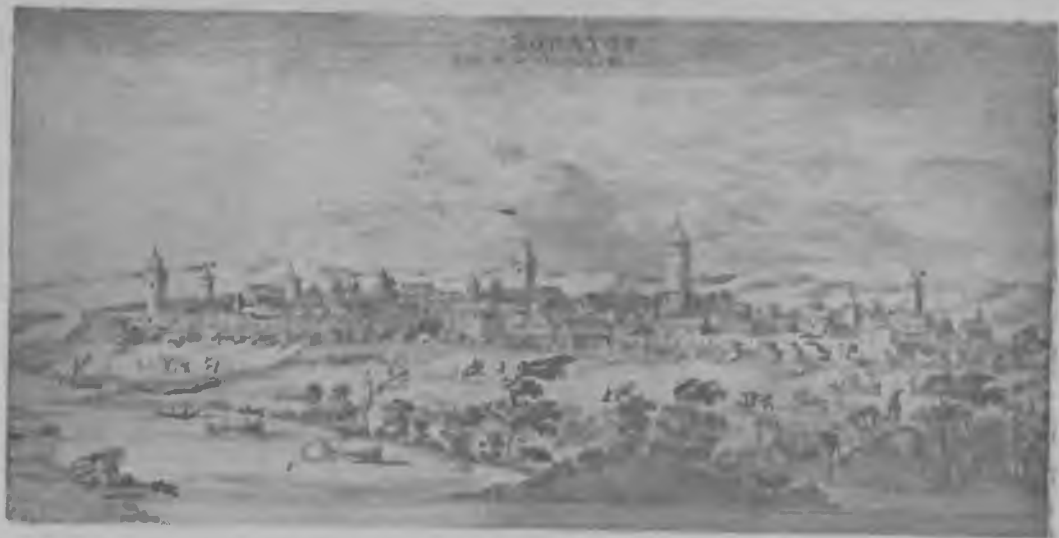
Вид г. Саратова из книги Оlearия, изданной в Амстердаме в 1727 году. Гравюра на меди. Отдел рукописей Научной библиотеки при СГУ.