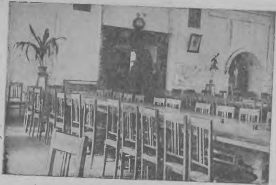
Саратовская центральная областная библиотека. Читальный зал.