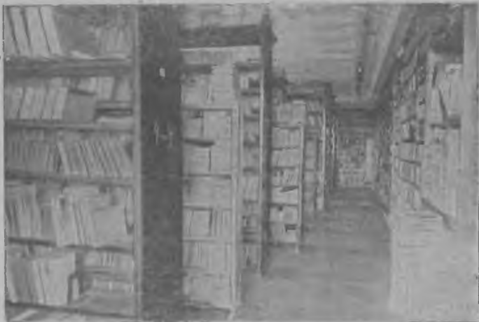
Научная библиотека при СГУ. Южное книгохранилище.