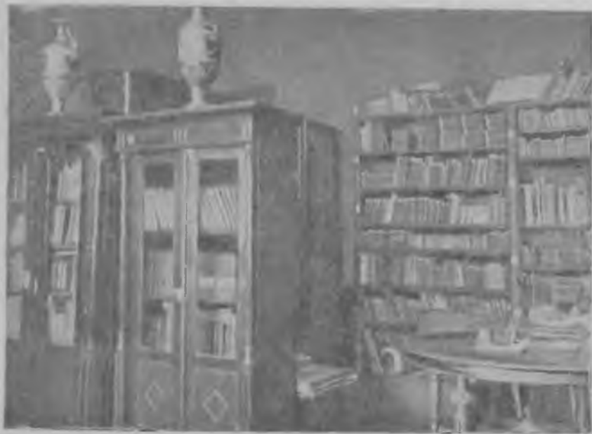
Библиотека художественного музея им. Радищева.