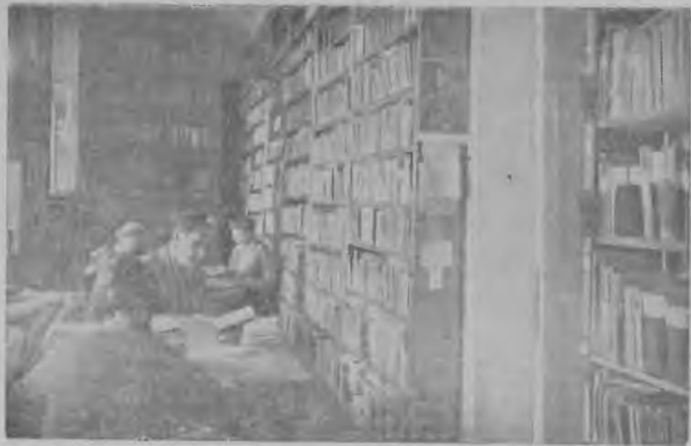
Научная библиотека при СГУ. Справочно-библиографический отдел.