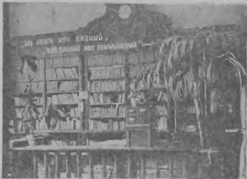
Абонемент библиотеки Саратовского зоотехническо-ветеринарного института.