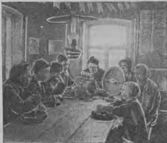
Слушают радио в Доме колхозника (Питерск. район, Пугачевск. окр.),

Опыт Березовки нужно распространить по всему району.