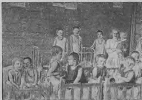
Детские ясли в колхозе им Сталина (Пугачев. округ).

Кое где намечается тенденция свести работу по подготовке дошкольниц к своего рода продолжительным совещаниям будущих дошкольниц. Против такой подготовки нужно возражать самым решительным образом. Курсы продолжительностью 250 час.—это минимум, от которого нельзя отступить ни на один шаг.