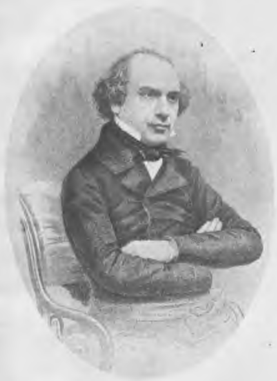
Т. Н. ГРАНОВСКІЙ.