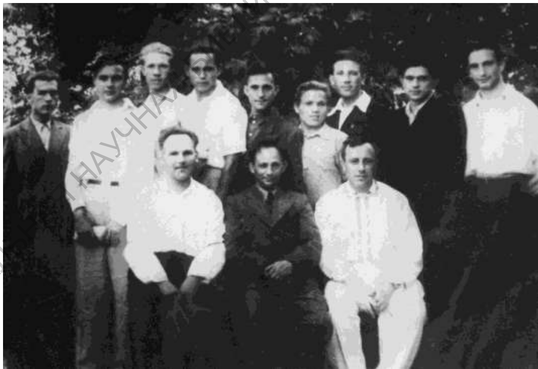
Первый послевоенный выпуск студентов кафедры теоретической физики СГУ.